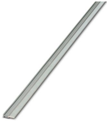
Puente enchufable sin fin, longitud: 500 mm, color: gris

Tenga en cuenta que los datos mostrados en este documento PDF se generaron a partir de nuestro catálogo online. Por favor, encontrará todos los datos en la documentación del usuario. Prevalecen nuestras condiciones generales de uso para descargas.